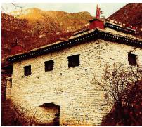
The "Temple Of Miraculous Fire" at Muktinath, Nepal. Photo by Ken Street (Nov. 1979).

[For more on this subject, please read our tract The Temple Of Miraculous Fire .]